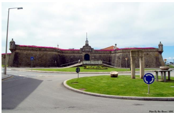
Fortaleza de Nossa Senhora da Conceição