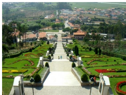
Monte de São Félix