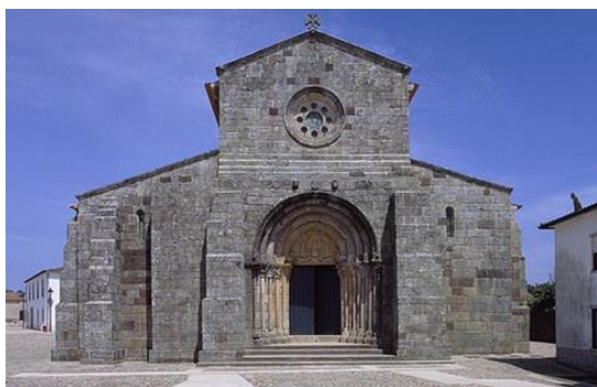
Igreja Românica de S. Pedro de Rates