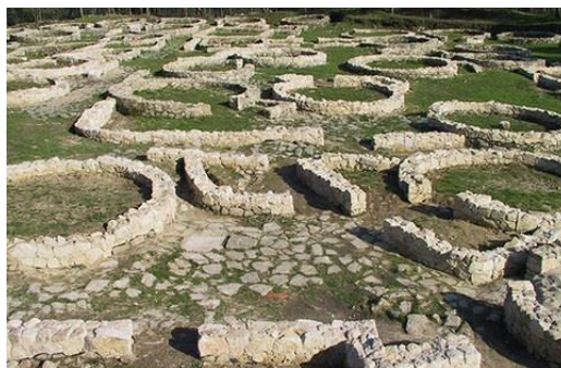
Cividade de Terroso