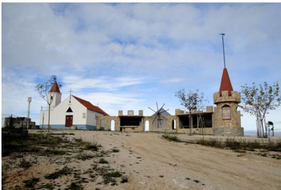
Capela de Santo António

Canhão do vale dos Poios: 39°58'57.76"N 8°33'19.18"W