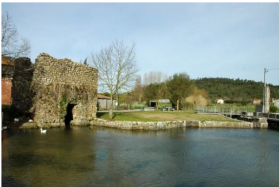
Castellum de Alcabideque