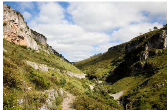
Canhão do vale dos Poios